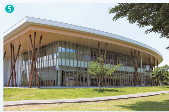
▲生涯学習センター「こもれびの森」開館(2018年)

白岡市は令和4年10月1日に市制施行10周年を迎えました。 この大きな節目を市民の皆様とともに迎えられたことに大きな喜びを感じるとともに、これまでの白岡市の市制発展にご協力とご尽力をいただいた市民の皆様、関係の皆様から心から感謝申し上げます。