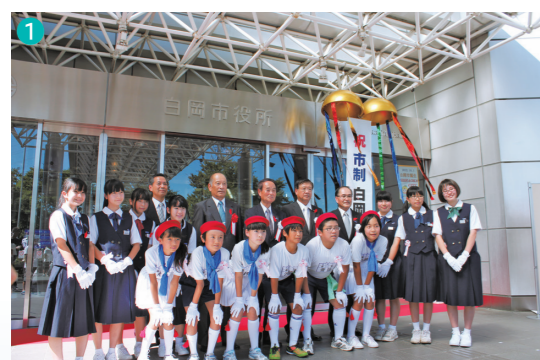
▲市制施行記念式典(2012年)