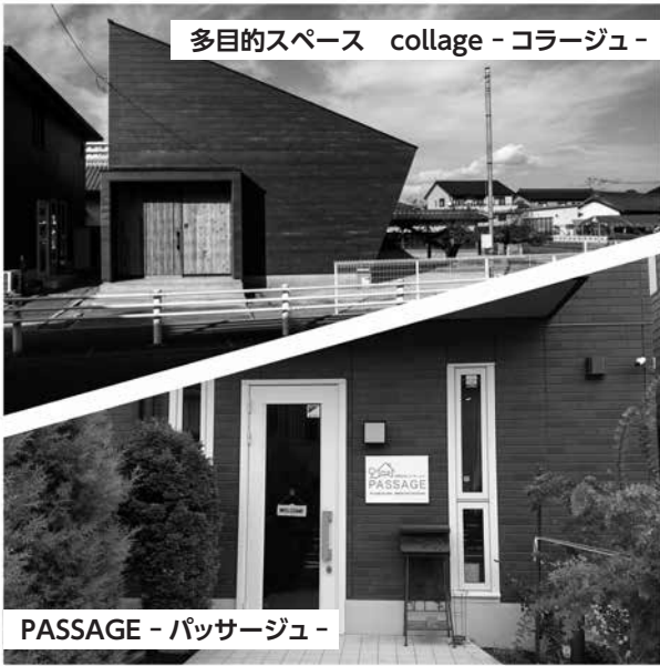
多目的スペース collage - コラージュ -