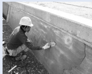
▲老朽化した水路壁のコーティング