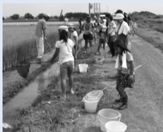
▲生態系保全 (田んぼの生きもの調査)

農地・農道・水路の軽微な補修、農業施設の機能診断、生き物調査などの生態系保全、植栽活動などの景観形成