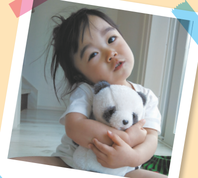
ここねちゃん お姉ちゃんになるよ😊

問合せ | 秘書広報課広聴広報魅力発信担当 ☎0480 (92) 1111 内線395・396