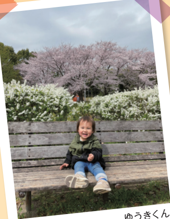
ゆうさくん お花見したよ!