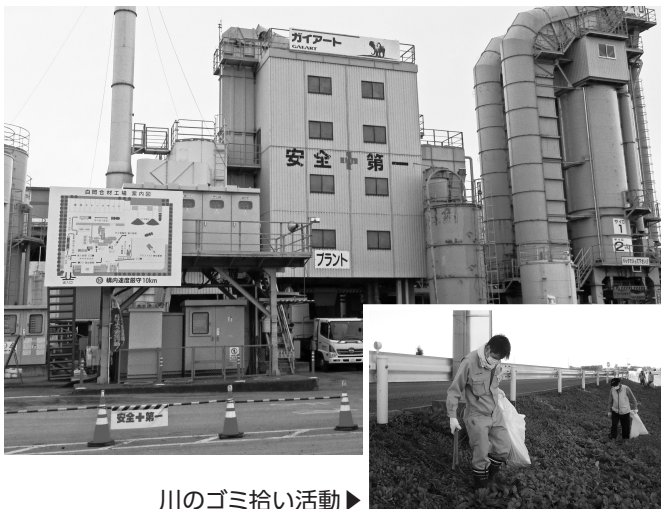
川のゴミ拾い活動▶