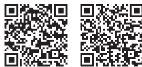
▲協賛店情報など ▲詳細はこちら

対 出生から18歳に達して次の3月31日を迎えるまでの子 が いる世帯、または妊娠中のかたがいる世帯 問 県少子政策課企画子育て ムーブメント担当 ☎048(830)3343 市子育て支援課子育て支援 担当 内線 152