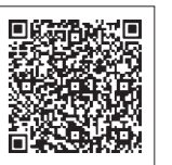
市公式ホームページ

市役所・生涯学習センター〔こもれびの森〕・保健福祉総合センター(はびすしらおか)・中央公民館・老人福祉センター・コミュニティセンター・市役所連絡所・勤労者体育センター・B&G海洋センター・白岡駅・新白岡駅・白岡郵便局・西白岡郵便局・白岡泉郵便局・大山郵便局・新白岡駅前郵便局・南彩農協白岡大山支店に設置します。 また、 市公式ホームページ にも掲載します。