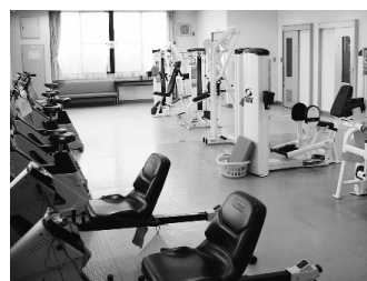
(いきいきさぼーと)