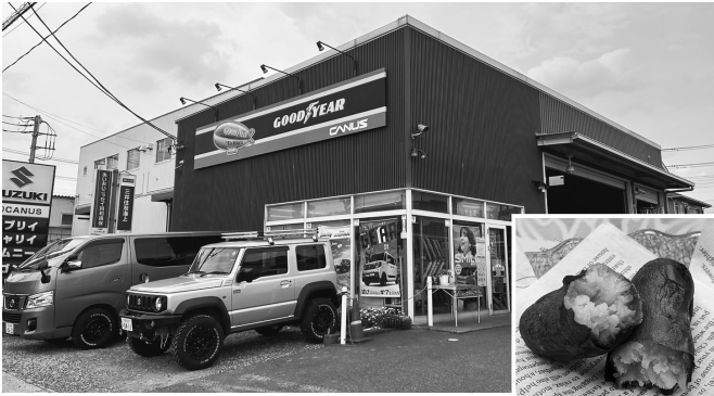
キャナイモ(焼き芋) ▶