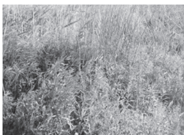
▲雑草が繁茂した農地