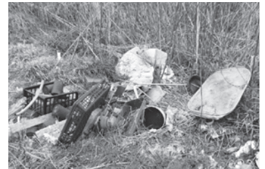
▲不法投棄された農地