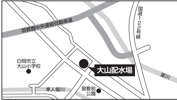
大山配水場 白岡市下大崎 1590-1

災害などで大規模な断水が発生した場合、 高岩浄水場 、 岡泉浄水場 及び 大山配水場 に給水拠点を開設します。各拠点に給水袋を備蓄していますが、数に限りがあるため、ポリタンクなどの容器をお持ちください。