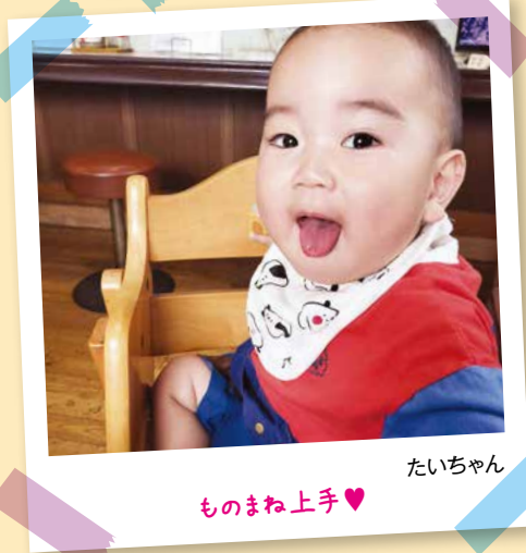
たいちゃん ものまね上手♡