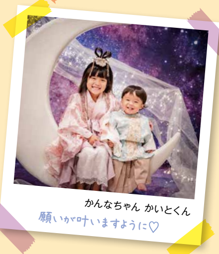
かなちゃん かいとくん 願いが叶いますように♡

問合せ | 企画政策課広聴広報魅力発信担当 ☎0480 (92) 1111 内線346・347