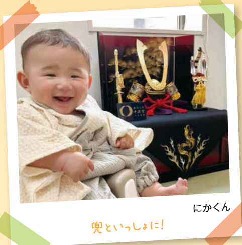
にかくん 兜といっしょに!