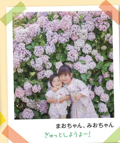
まおちゃん、みおちゃん ぎゅっしようよー!