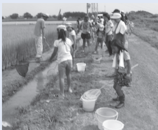
▲生態系保全 (田んぼの生きもの調査)

農地・農道・水路の軽微な補修、農業施設の機能診断、生きもの調査などの生態系保全、植栽活動などの景観形成