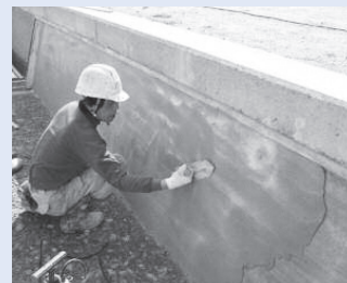
▲老朽化した水路壁のコーティング