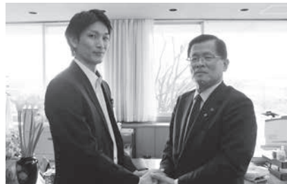
▲総務課主任 派遣期間:2月19日(月)~26日(月)