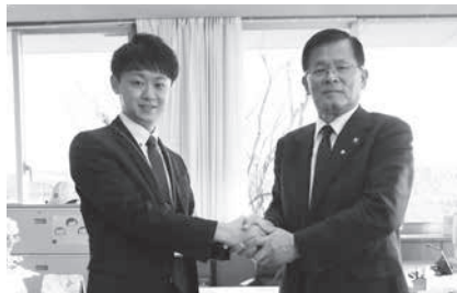
▲税務課主事 派遣期間:1月29日(月)~2月5日(月)