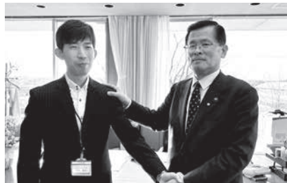
▲安心安全課主任 派遣期間:2月12日(月)~19日(月)