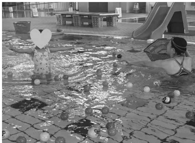
▲親子スキンシップスイム