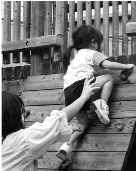
▲園庭で遊びましょう