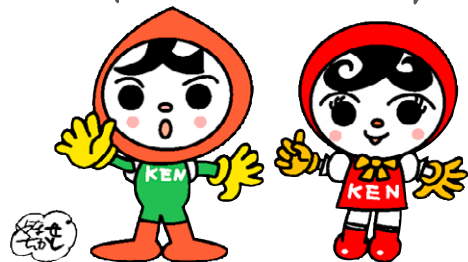
人権イメージキャラクター 人KENまもる君 人KENあゆみちゃん