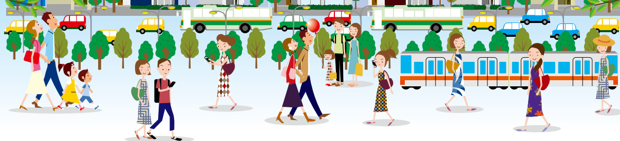
白岡駅東口駅前広場整備イメージ図