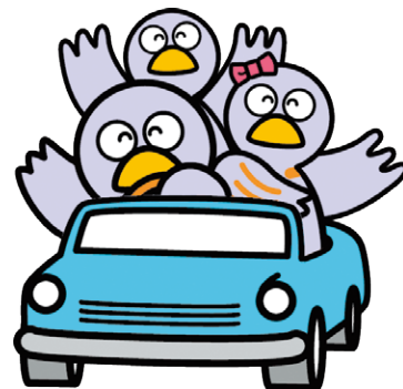
県マスコットキャラクター コバトン