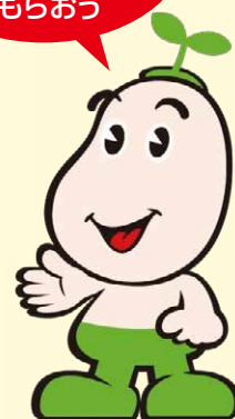
国保マスコット 健康まもるくん