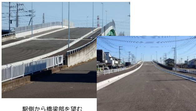
駅側から橋梁部を望む

都市計画道路白岡宮代線は、東北自動車道で分断されている白岡市の東側と白岡駅東口駅前及び白岡駅東部中央土地区画整理事業地内を連絡し、市役所、はびすしらおか、こもれびの森、南中学校などの公共施設に接続する重要な道路ネットワークを形成する路線です。