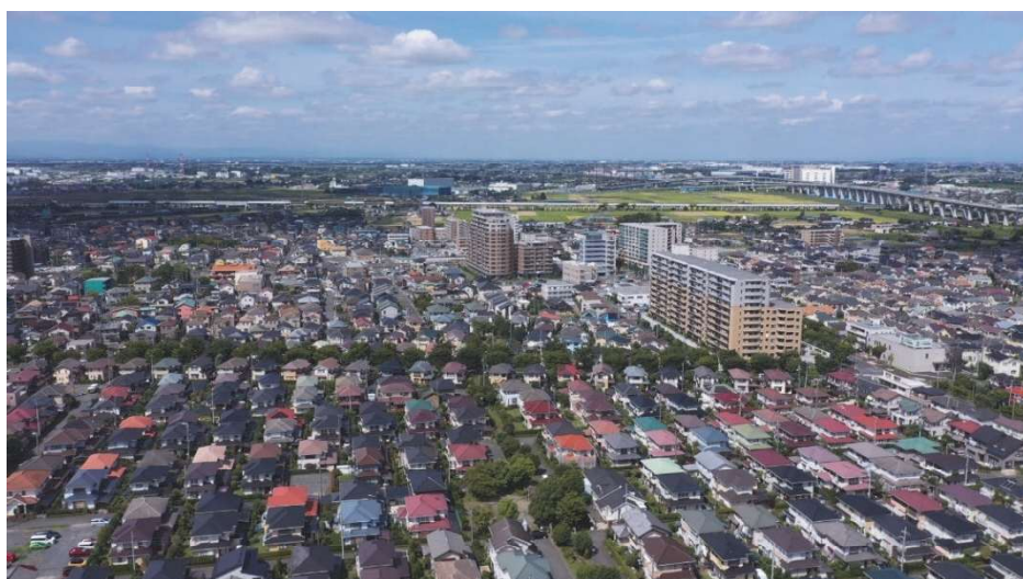
新白岡のまちなみ