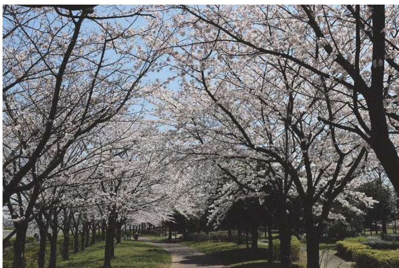
ふれあいの森公園（小久喜地内）