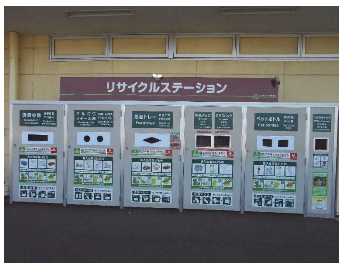
市内のスーパーマーケットに設置されているリサイクルステーション