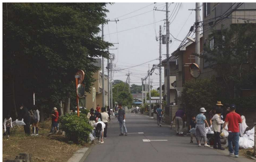
ごみゼロ・クリーン運動

※ごみゼロ・クリーン運動参加者数は年々減少しているため、直近3か年の数値を基に目標値を変更した。