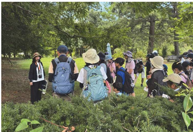
環境学習会（環境関連施設の見学）