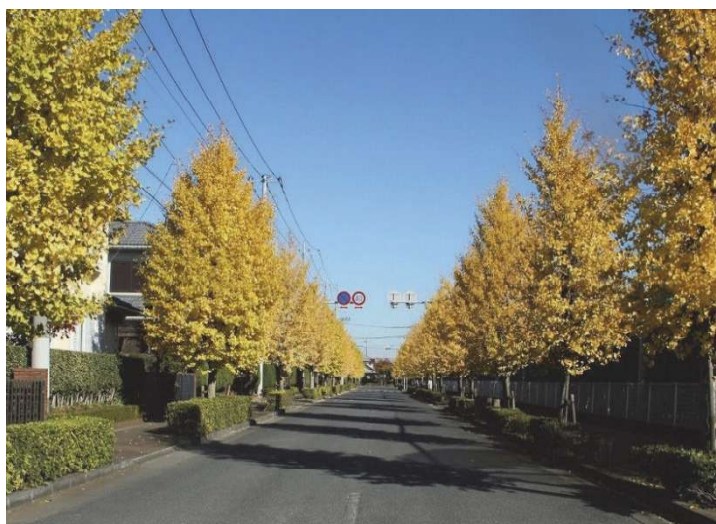
新白岡学園通りのまちなみ