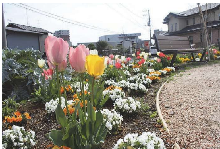
まちなか花のオアシスガーデン（白岡地内）