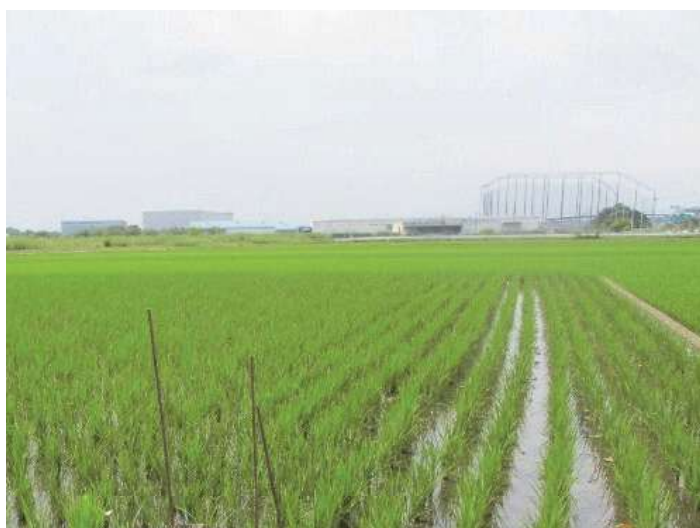
市内に広がる田園風景