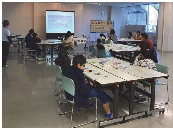
環境学習会（親子エコスクール）

※環境学習会・講座累計参加者数と緑のカーテン活用講座累計受講者数の累計の目標は令和3年度以降の累計とする。