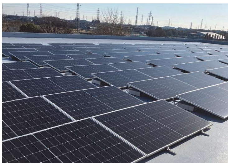
白岡市生涯学習センター〔こもれびの森〕の屋上に設置されているソーラーパネル