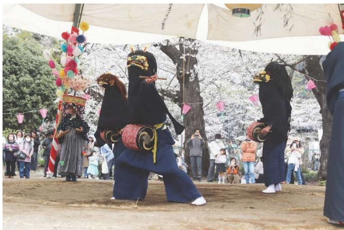
市無形民俗文化財 小久喜の獅子舞（小久喜地内）