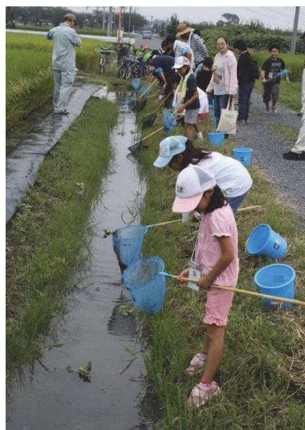
市内を流れる用水路 (田んぼの学校生物観察会)