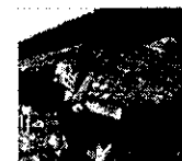
緊急代執行を要する 崩落しかけた屋根