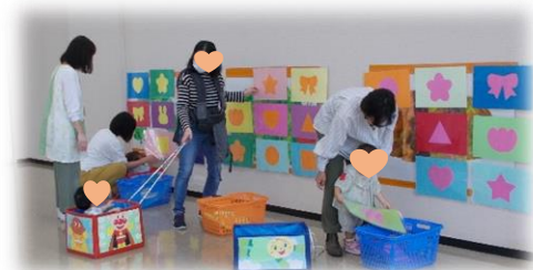
パネルをはがしていくと絵が見えてきたよ!