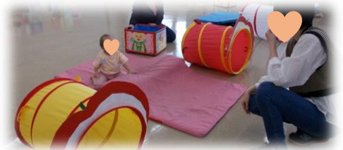
最後はマットのお山を越えてゴール!