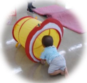
りんごのトンネルをくぐり、箱車に乗ります