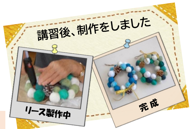
講習後、制作をしました