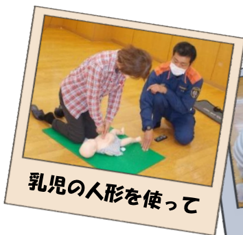
乳児の人形を使って