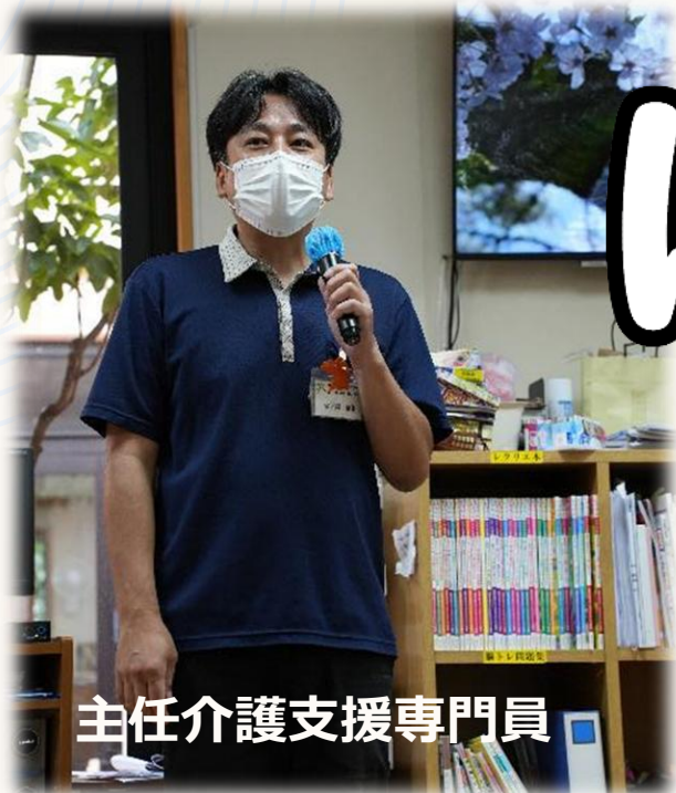
主任介護支援専門員