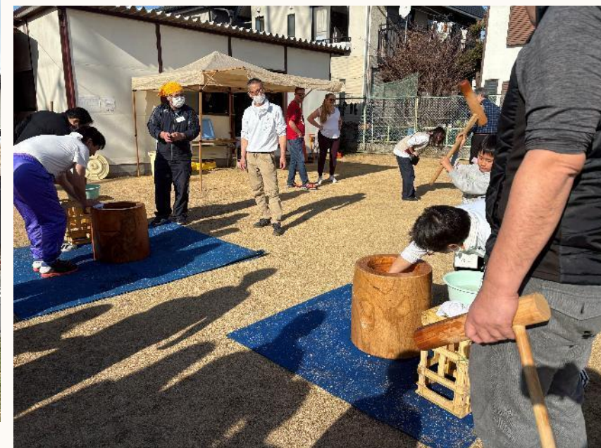
地域の防災訓練での指導協力 お祭り、餅つき等のイベント協力