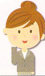
主任ケアマネジャー