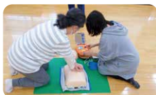
▲協力会員は5年に1回以上救命講習や虐待防止に関する講習を受講します。

ファミリー・サポート・センターの入会説明に参加し、入会申込書を提出します。入会説明日は可能な限りご希望に合わせて随時実施します。