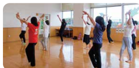
▲協力会員向けに年2回研修会や交流会を実施しています。健康体操や会員同士の交流、制作を行います(自由参加)。