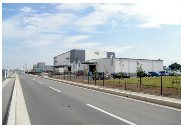
白岡西部産業団地

また、白岡西部産業団地の北側は、周辺の自然・農業・景観等との調和を保ちながら、白岡菖蒲インターチェンジ及び国道122号に近接する広域交通の拠点性を活かして産業を誘致する『産業拠点』として位置づけます。