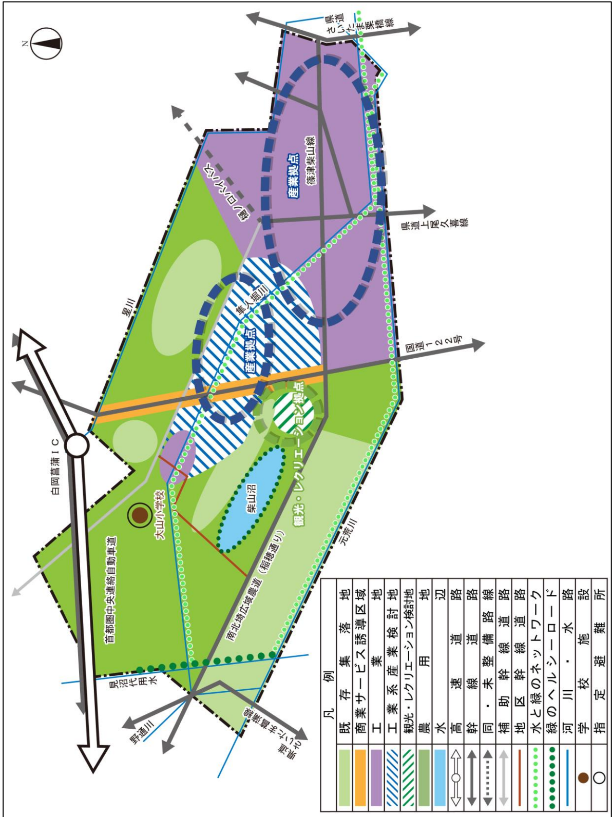
まちづくり方針図 大山地域