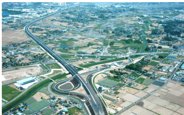
白岡菖蒲インターチェンジ