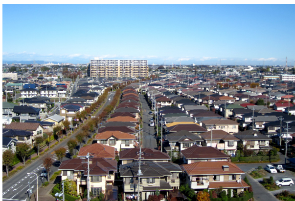
白岡ニュータウン