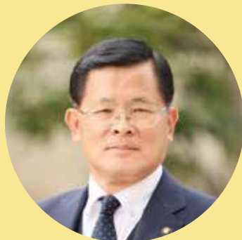
藤井 栄一郎 市長 白岡市長