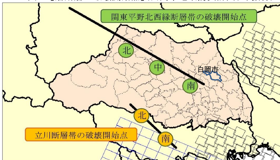
図1 【活断層の破壊開始点】(白岡市地域防災計画より抜粋)