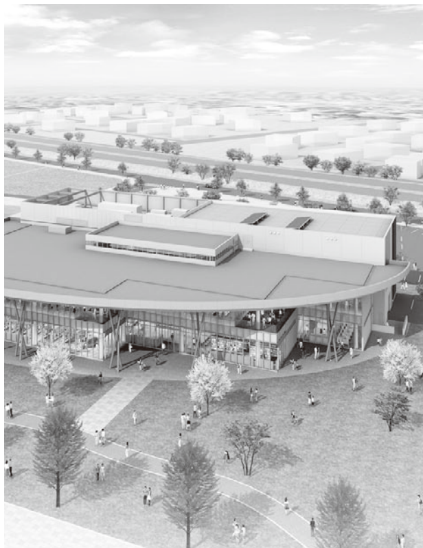
生涯学習センター

答 建物ごとに、行政区、所在地、所有者などの住所、氏名、連絡先、危険度、相談対応の記録、建築課と合同で実施した建物調査結果などを空家ごとに入力している。