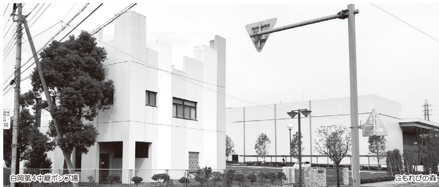
白岡第4中継ポンプ場

歳入は、介護保険料は前年度と同程度の収納率が確保され、国や県などの法定負担分については適正に財源が確保されています。歳出は、介護予防や地域高齢者を支えるための事業に取り組んでおり、本決算は介護保険制度にもとづき適正と認め、賛成します。