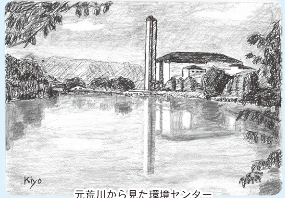
元荒川から見た環境センター

歳出の主なものは、衛生費(ごみ・し尿の処理にかかる経費)で全体の69.8%を占め、総務費(事務的経費)が21.7%です。