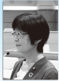
菱沼あゆ美 議員 (公明党)

道路の不具合箇所をスマートフォンなどから手軽に通報できるシステムは、安全な道路環境維持のための有効な手段のひとつである。道路のさらなる安全維持のため、先進自治体の例を参考にしながら、システムの導入に向けて調査・研究していく。