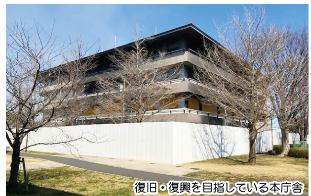
復旧・復興を目指している本庁舎

答 令和7年度白岡市一般会計補正予算(第9号)で認めていただいたとおり、建物内の什器搬出等のため、火災後の庁舎内清掃業務を実施しているところである。本庁舎の復旧・復興に当たっては、早期の実現を目指していく。また、令和8年度当初予算において、庁舎火災を要因とした事業廃止、事業費の縮小及び事業の先送りは発生していない。