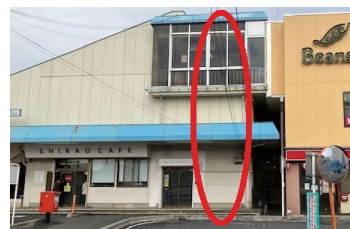
設置予定場所 (囲み部分)