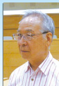
遠藤 誠 議員 (WAKABA)

現在は休止中となっているが、せせらぎ公園内に水遊びができる施設がある。その他の都市公園では、市の許可を得て水遊びの道具を持ち込み遊ぶことが可能である。新たな公園の整備に際しては、利用者等の意見を聴きながら、水遊び施設の設置について検討する。