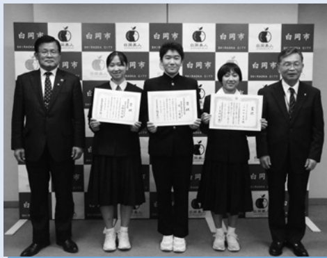
令和3年12月8日に市役所で表彰式が行われ、市長、教育長から賞状と記念品が贈呈されました。