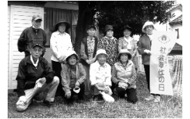
清掃ボランティア

問合せ コミュニティセンター ☎ 0480 (92) 4760 地域振興課市民協働担当 ☎ 0480 (92) 1111 内線 382