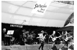
バンドフェスティバル