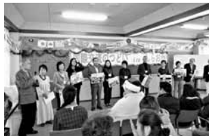
毎年12月に楽しいパーティーを開催しています。