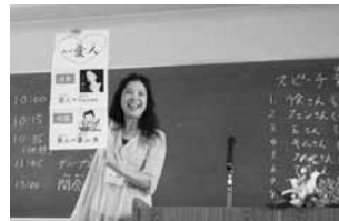
日本語で自分の思いを話してみよう！