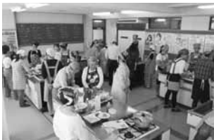
おいしいフィリピン料理をつくりました。