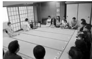
日本の文化をみんなで体験！