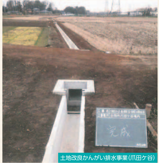
土地改良かんがい排水事業(爪田ケ谷)