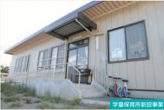
学童保育所新設事業