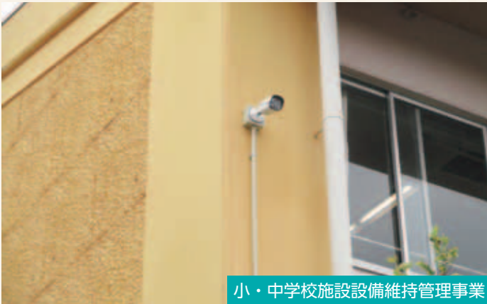
小・中学校施設設備維持管理事業