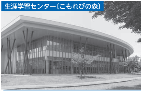
生涯学習センター「こもれびの森」

までのこども医療費の無償化や待機児童の解消に向けて民間保育所の誘致を行いました。