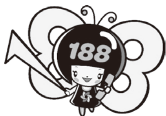
消費者庁 消費者ホットライン188 イメージキャラクター 「イヤヤン」

そんなときは一人で悩まずに、全国どこからでも3桁の電話番号でつながる消費者ホットライン「188 (いやや!)」にご相談ください。専門の相談員がトラブル解決を支援します。