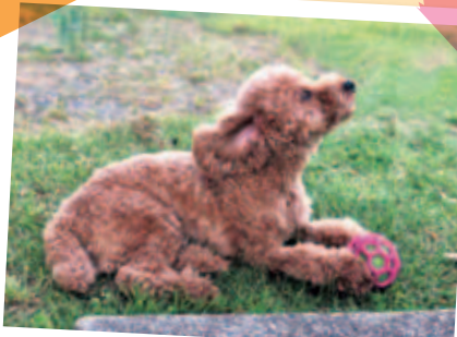
風が気持ちいいなま〜