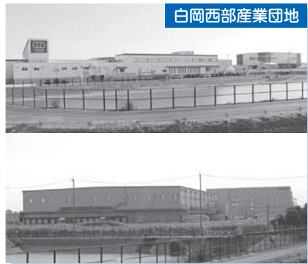
白岡西部産業団地

など、何事においても、市民の皆様が積極的に市政にご参加いただいているおかげでございます。