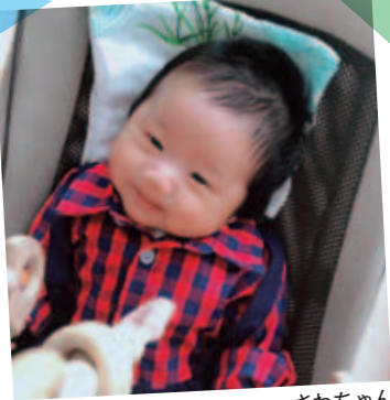
揺れるおもちゃはおもしろいな