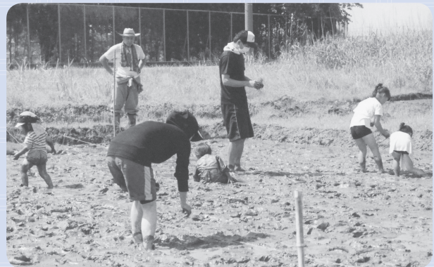
間隔を空けて田植えをしています。

篠津こども農園（愛称「ムクロゲ」）では、機械を使わずにシャベルで耕した田に水を入れて、親子で田植えを行いました。