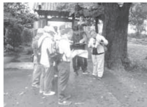
白岡遺産ワークショップ「フィールドワーク」

具体的には、7月頃を目途に「白岡遺産キックオフ・ミーティング」を、秋から冬にかけてパブリック・コメントを実施するとともに、この期間内に市民シンポジウムを開催します。