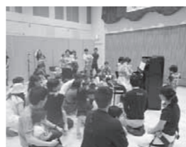
みんなあつまれ!! わいわいコンサート♪

今後も、地域と学校の連携をいっそう強め、特色のある地域づくりや学校支援に努めていきます。