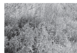
管理されていない農地は近隣の農地に迷惑をかける可能性があります。