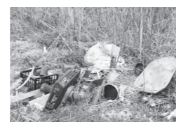
廃棄物を不法投棄してしまうこともあります。