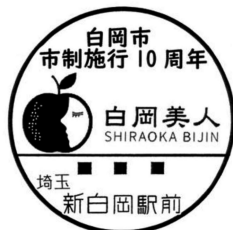
新白岡駅前郵便局