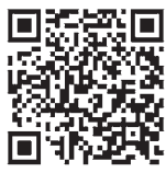
消防局ホームページ