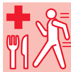
健康管理 バランスのよい食事や 適度な運動