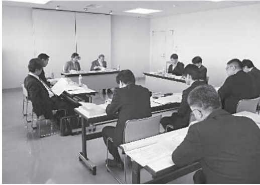
行政評価委員会の会議の様子

市では、行政経営の透明性を確保し、より効果的で効率的な市政運営を推進するため、市が実施した事務事業の内部評価並びに学識を有するかた及び公募に応じたかたで構成する白岡市行政評価委員会による外部評価を行いました。