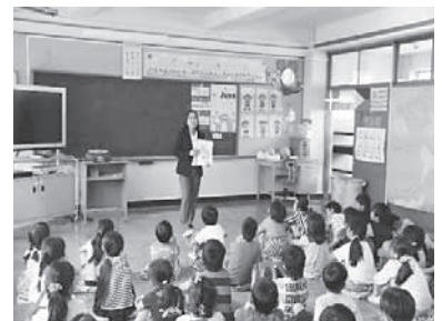
英語指導助手（AET）による授業の様子

英語指導助手（AET）の配置人数や、時間割の見直しなどについて、改善提案をいただきました。