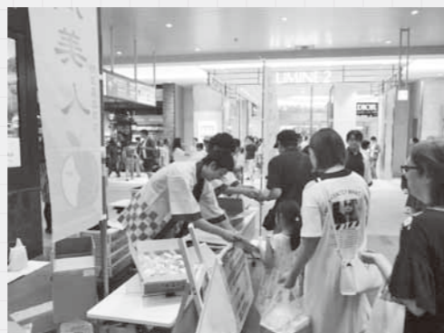
大宮駅でのPRの様子