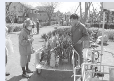
リヤカー隊がネギを販売している様子

リヤカー隊と地域の皆さんとで企画したイベントの開催や、地域のお祭りへの参加を通して、地域の皆さん同士が関係を深めるきっかけを作りました。