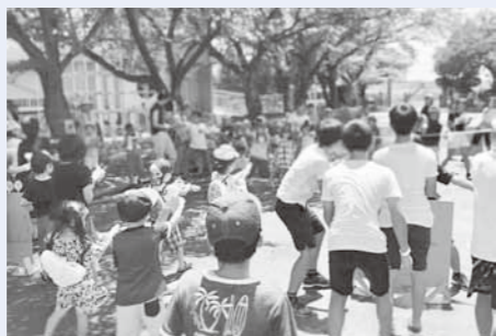
水鉄砲合戦の様子 普段の学校生活では味わえない非日常を創出できました。

大山地域元気会議の主催によるランタンナイトを大山地域の名物として定着させるため、大山チームも参加しました。