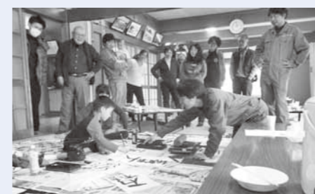
地域の皆さんで書き初めを楽しむ様子 書き初めが自然に会話を生み出してくれました。