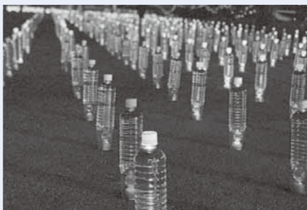
ペットボトルを利用して作ったランタンを並べた様子 地域に愛されるイベントを目指しました！

※大山・菁莪地域元気会議とは… それぞれの地域における市民同士の交流を深めることを目的として、設置された組織です。