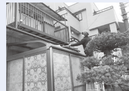
お助け隊がサンルーフを掃除している様子