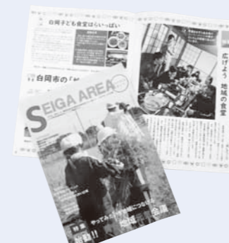
これで地域の情報まるわかり！