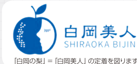
「白岡の梨」＝「白岡美人」の定着を図ります